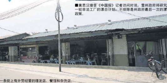
■同一条街上有外勞經營的理髮店、餐館和雜貨店。

他说，这些建在农业地的工厂因建筑物设计不符合适转业的条款，加上土地用途未转换，所以没有完整的执照。