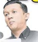
沙魯阿茲瓦：我國沒有法令管制如何處置回鍋油。

(安邦23日訊)安邦再也市議會持續推動綠化城市項目，其中回收回鍋油計劃效果顯著，截至今年9月，已回收了4萬9006.09公斤。