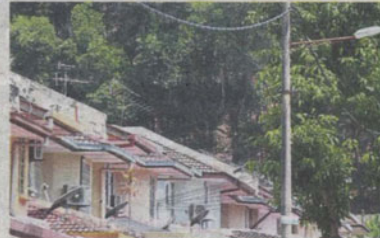
Residents living along Jalan Kesuma are concerned that trees on the slope behind their houses will fall during a storm.

At night, the vehicles' emergency lights and engines were left run-