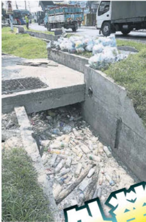
■沟渠里满是塑料瓶，一旦下雨就会影响排水流畅度。

Provided for client's internal research purposes only. May not be further copied, distributed, sold or published in any form without the prior consent of the copyright owner.