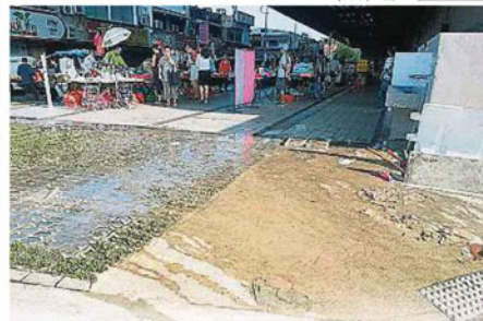
▲污水经常从巴刹内狭小的沟渠倒流，并流向道路和臭味熏天，顾客闻之却步，小贩生意大受影响。