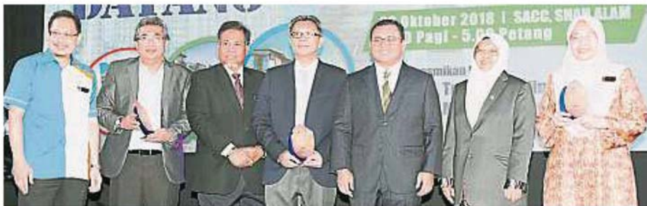
▲大臣阿米鲁丁(右三)颁发奖项给合作的开发建造商，盼未来的房屋发展取得双赢的局面。

“目前，我们已经完成了6303个单位，现在正建造2万2336个单位，以便屋主能在2018至2022年之间阶段性的陆续搬入，并希望雪州政府能够实现既定的目标。”