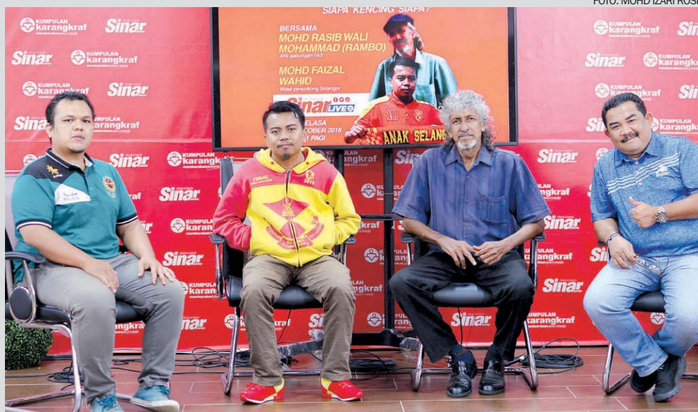
Barisan panel Sukan Sinar Live membincangkan tsunami bola sepak Selangor.