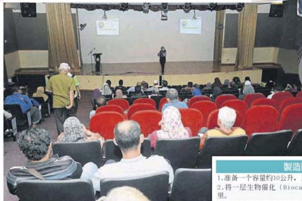
羅姬雅分享如何善用廚余製造堆肥。