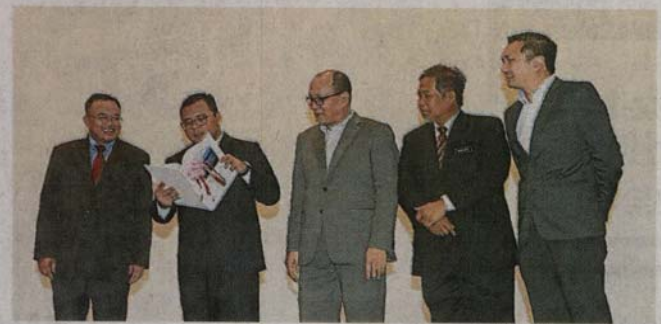
■阿米鲁丁（左二）为“雪州永续水供研讨会”主持开幕仪式后，翻阅相关报告。右起为黄思汉、莫哈末阿敏及依兹汉。

大臣披露，早前有研究显示，我国降雨量高，每年预计有193亿公升降雨量，惟其中33%雨水用作水供用途，其余的则将流入大海。