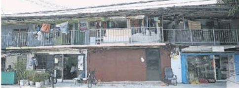
■雙溪毛糯新村的外勞人數龐大，有些業主將單位出租給外勞當住屋。