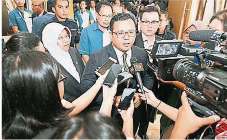
雪州州务大臣阿米鲁丁，促请各州大臣的领导人尽快落实将结婚年龄调高至18岁以保护儿童的权益。