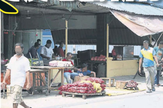
■住在雙溪毛糯新村的外勞除了在工廠打工，部分外勞也會做生意。

“儘管如此，地方政府和州政府都沒有採取限制外勞離開，只能配合移民局和警方展開聯合取締行動。”