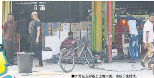
■外劳在五脚基上出售肉类，造成卫生隐忧。