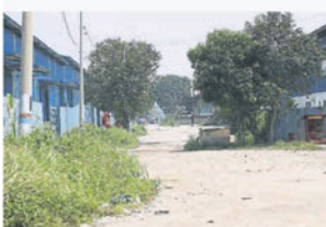
■外勞夜市位于Utus Teratai 4路，每逢周日营业。

她说，有些地主是长者，没有能力拿出地皮转换土地用途，加上已经年老，银行也无法批出贷款，所以导致漂白白计划陷入胶着状态。