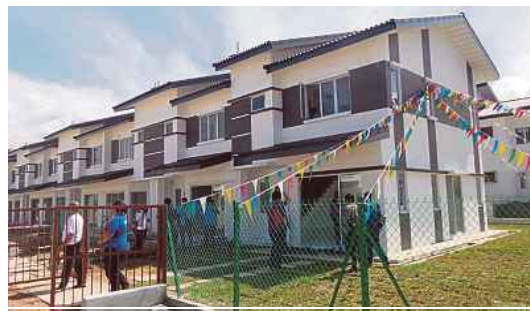
A 'Rumah Selangorku' show house in Serendah.

"The new policy, which has been known as 'Rumah Selangorku 2.0' since April, provides a win-win situation for buyers and developers. We lowered the maximum price of up to RM250,000 previously to RM230,000.