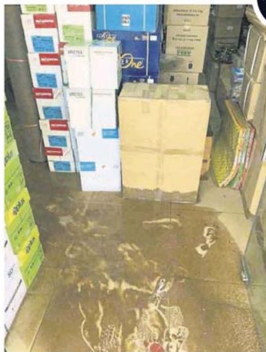
■黄先生的文具店遭受黄泥水侵袭，损失1万令吉。