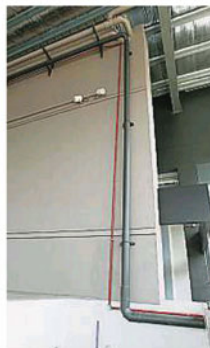
▲灵市十七区圣淘沙早市巴刹却是采用水泵将污水往上泵，而且一泵就是大约20呎高，令该巴刹的公会议事感到非常纳闷。