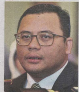
Amirudin is confident Selangor can reach its target of 20,000 affordable homes by 2019.

They were PKNS, Sin Heap Lee Sdn Bhd and Gabungan Efektif Sdn Bhd.