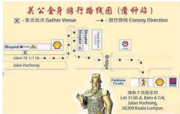
■蒲种站的关公金身游行的路线图，路线全长1.7公里多。

“希望通过国际关公文化节的的活动，能进一步的推广关公文化，提倡关公的忠义仁信的精神。”