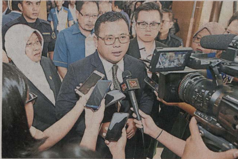
儿童的权益。 尽快落实将结婚年龄调高至十八岁以保护儿童。 雪州务大臣阿米鲁丁促各州大臣的领导人