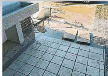
▲源源不绝的污水不断流向路面，臭味熏天，令人闻之作呕。

他指出，由于水泵太小，所以才会“力有不逮”，无法发挥太大作用，流出路面的污水发出臭味，吓跑不少顾客。