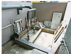
▲小贩公会认为水泵太小及经常失灵是导致污水停滞在沟渠内，有时却满溢流向路面，惟真正源头有待当局调查。